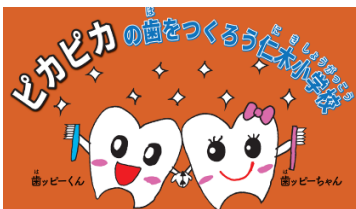
(児童の公募によるキャラクター)